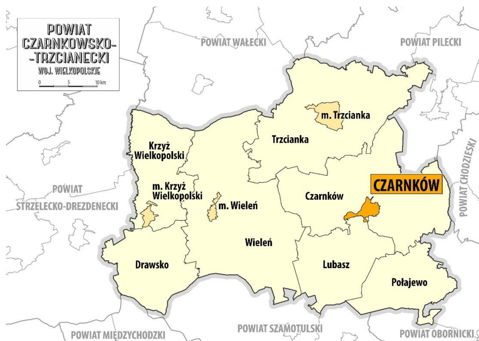
Rys. 1 Położenie miasta Czarnków na tle powiatu czarnkowsko-trzcianeckiego.

Gmina Miasta Czarnków położona jest w północno-zachodniej części województwa wielkopolskiego w powiecie czarnkowsko-trzcianeckim. Od południa graniczy z gminą Lubasz, a z pozostałych stron otoczona jest gminą wiejską Czarnków.