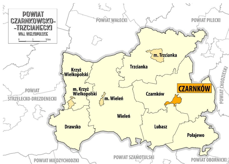
Rys. 1 Położenie miasta Czarnków na tle powiatu czarnkowsko-trzcianeckiego.

Gmina Miasta Czarnków położona jest w północno-zachodniej części województwa wielkopolskiego w powiecie czarnkowsko-trzcianeckim. Od południa graniczy z gminą Lubasz, a z pozostałych stron otoczona jest gminą wiejską Czarnków.